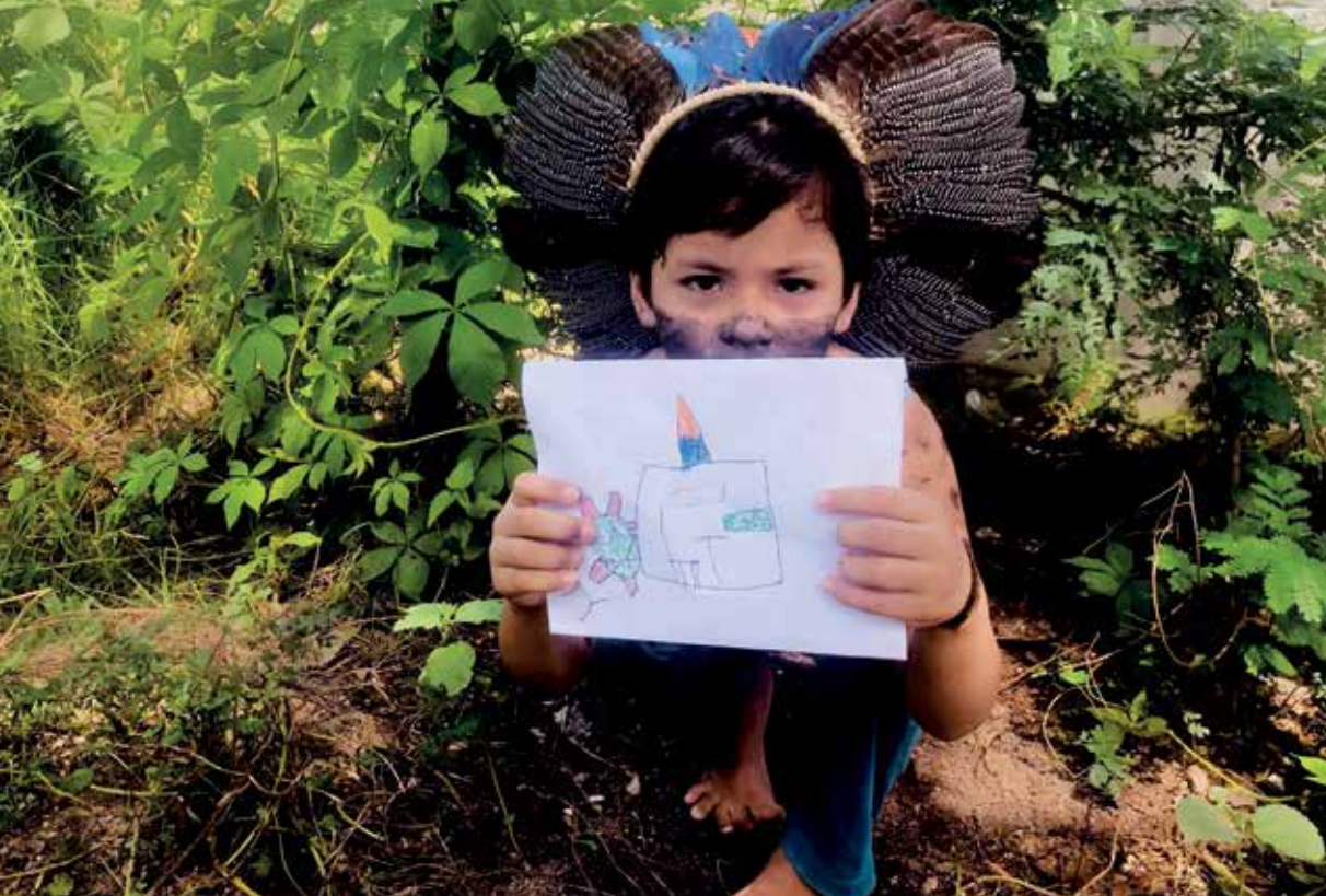
Criança do aldeamento indígena fulni-ô, em Águas Belas (PE), segura desenho sobre o coronavírus