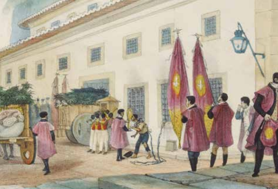
Destaque em quadro de Jean-Baptiste Debret mostra a entrega de mantimentos a prisioneiros, em 1839

1 eleições indiretas e o voto censitário”, resume. Os arquitetos da nova ordem política e jurídica conceberam um princípio de “governo misto”, conjugando elementos populares (como as eleições), aristocráticos (como o Senado vitalício) e monárquicos (como o imperador). “Os debates da época no Brasil mostram que havia muito desejo de mudar, combinado com o temor das inclinações passionais das ‘massas’, tanto de homens livres quanto de escravizados. As convulsões e instabilidades das décadas de revolução eram bem conhecidas e assustavam muito”, afirma Lopes.