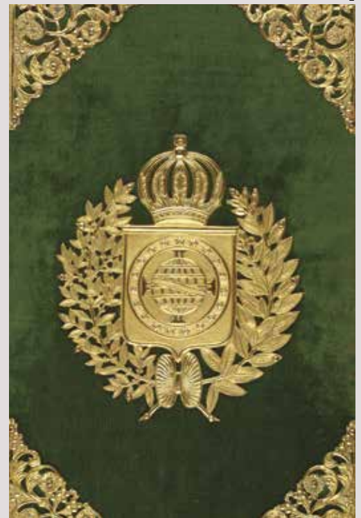
A Constituição brasileira de 1824 adotou o modelo das cartas europeias da Restauração

A Constituição de 1824 previa a criação de um Supremo Tribunal de Justiça (STJ) para julgar empregados privilegiados, como ministros, conselheiros de Estado, empregados diplomáticos, presidentes de província, e conceder revista nos processos julgados, em segunda instância, nos tribunais de Relação. O STJ passou a funcionar em 1828. Mas a Casa de Suplicação, criada no Brasil quando da chegada da família real, só deixou de existir em 1833. A Carta outorgada previa também a elaboração de códigos – mencionando especificamente o Civil e o Criminal. Enquanto os novos textos eram elaborados, o país manteve total ou parcialmente vigentes as leis de seu tempo de Colônia. Os dois primeiros códigos – Criminal e de Processo Criminal – foram adotados, respectivamente, em 1830 e 1832. As discussões sobre um código comercial começaram na década de 1830, mas ele só foi aprovado em 1850. Na segunda metade do século, foram debatidos projetos de um Código Civil. Ele só seria aprovado, contudo, em 1916.