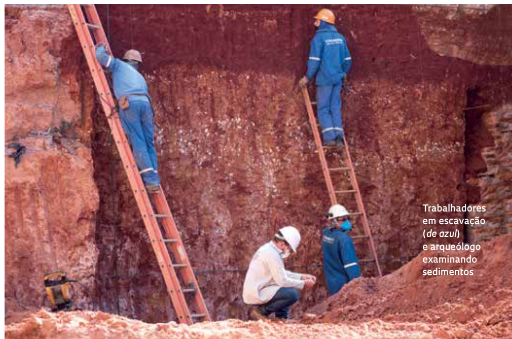
Trabalhadores em escavação (de azul) e arqueólogo examinando sedimentos

Durante a reforma do Museu Paulista, o resgate arqueológico de objetos traz mais informações sobre sua história