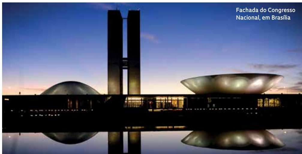
Fachada do Congresso Nacional, em Brasília

Parlamentares promovem novos cortes nos recursos para a ciência e reduzem o orçamento suplementar da área para R$ 89,7 milhões