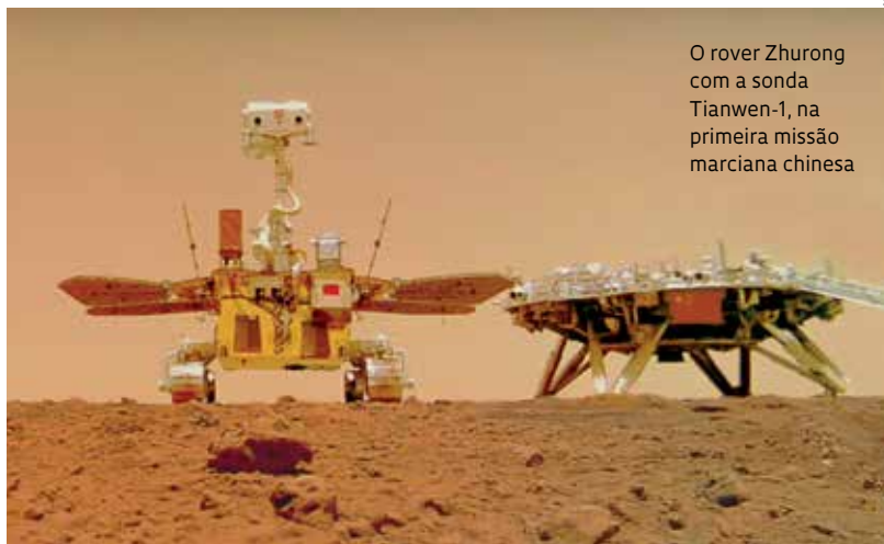
O rover Zhurong com a sonda Tianwen-1, na primeira missão marciana chinesa

O Mars Rover Penetrating Radar (RoPeR), radar de penetração do solo da Tianwen-1, primeira missão marciana da China, mostrou que o solo de Marte é bastante heterogêneo e geologicamente complexo, com estruturas que se assemelham a paredes de crateras, moldadas pelo clima e pela erosão eólica. Diferentemente, dados comparáveis do lado oculto da Lua são bastante uniformes, mesmo que as duas superfícies tenham sido formadas em épocas geológicas próximas. Lançada em 23 de julho de 2020, a sonda Tianwen-1 foi capturada pela atmosfera de Marte em 10 de fevereiro de 2021 após uma jornada de 202 dias e 475 milhões de quilômetros. O RoPeR é um dos instrumentos científicos do rover (veículo controlado remotamente) Zhurong, que pousaram na região conhecida como Utopia Planitia em 15 de maio de 2021, com o propósito de examinar os efeitos do vulcanismo, do gelo e do vento, a partir dos quais se poderá conhecer melhor a evolução do ambiente do planeta ( Geology , 9 de fevereiro).