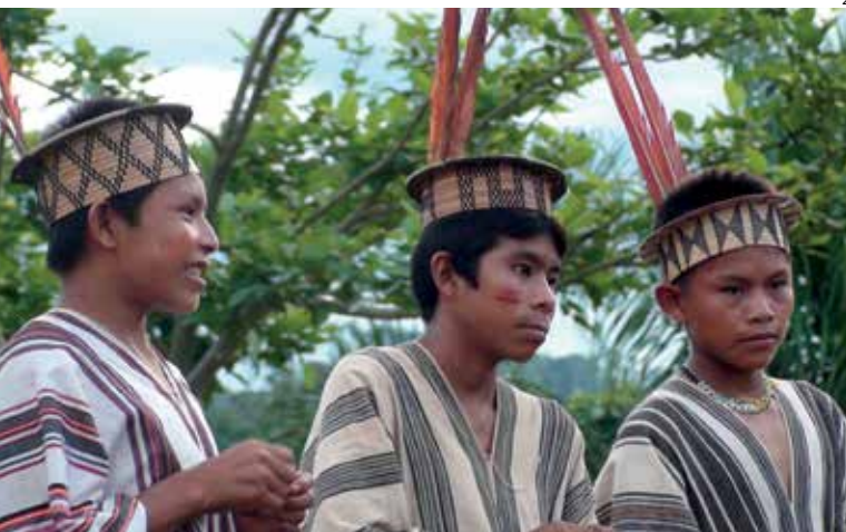
Estudantes da comunidade ashaninka de Pamaquiari, no Peru