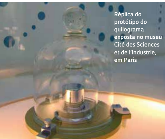
Réplica do protótipo do quilograma exposta no museu Cité des Sciences et de l'Industrie, em Paris