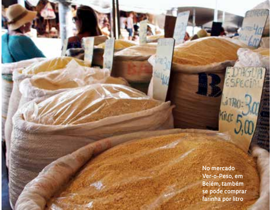
No mercado Ver-o-Peso, em Belém, também se pode comprar farinha por litro

E m 1875, já fazia mais de uma década que o Brasil havia adotado oficialmente o novo sistema. A Lei Imperial nº 1.157, assinada por dom Pedro II em 1862, dava o prazo de 10 anos para a adaptação ao sistema métrico francês e determinava sua inclusão nos programas das escolas de instrução primária, públicas e particulares. De acordo com um artigo da matemática Elenice Zuin, da Pontifícia Universidade Católica de Minas Gerais (PUC-MG), publicado em 2017 na Educação Matemática Pesquisa , antes mesmo da promulgação da lei já circulavam no