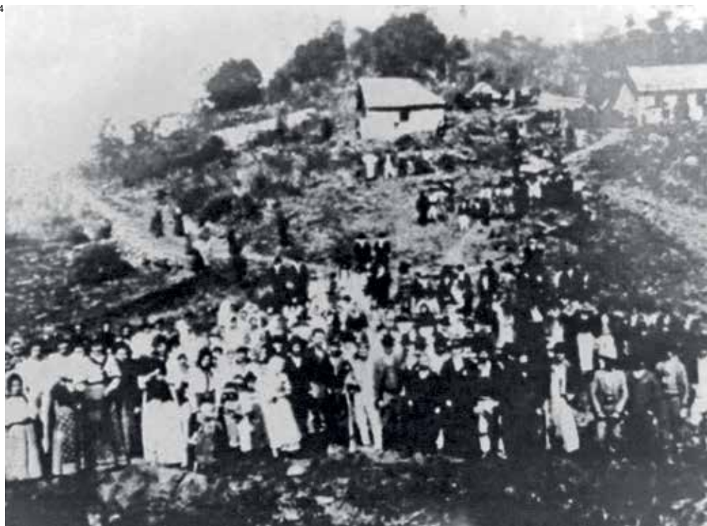
Rara fotografia da Revolta do Quebra-quilos, em 1874, no interior do Nordeste