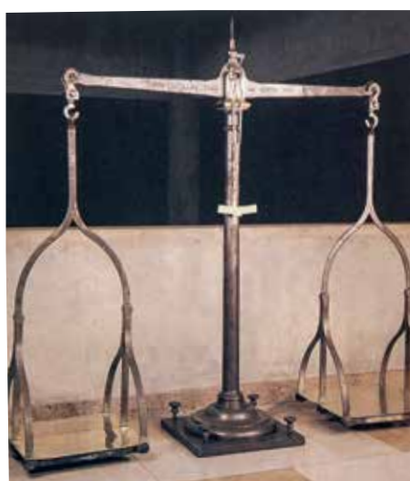
Padrões de massa (foto maior) e volume (abaixo) feitos pelo Arsenal de Lisboa a pedido do príncipe regente dom João; balança fabricada no Brasil em 1856