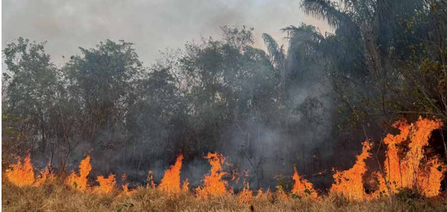
Queimada no município de Cantá, em Roraima, em fevereiro deste ano

FOTO ALAN CHAYES/APP VIA GETTY IMAGES INFOGRÁFICO ALEXANDRE AFFONSO/REVISTA PESQUISA FAPESP