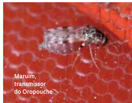
Maruim, transmissor do Oropouche

A epidemia poderia aumentar ainda mais se as linhagens de Orov se adaptarem aos insetos que vivem em áreas urbanas centrais, como o pernilongo comum ( Culex quinquefasciatus ) e Aedes aegypti . O virologista Pedro Vasconcelos, do Instituto Evandro Chagas (IEC), de Belém, coordenador do Instituto Nacional de Ciência e Tecnologia para Vírus Emergentes e Reemergentes (INCT-Ver), e Arruda minimizam a possibilidade de o pernilongo se tornar um transmissor do Orov, porque experimentos em laboratório demonstraram sua pouca eficiência em transmitir o vírus. Testes semelhantes não foram feitos com a nova variante.