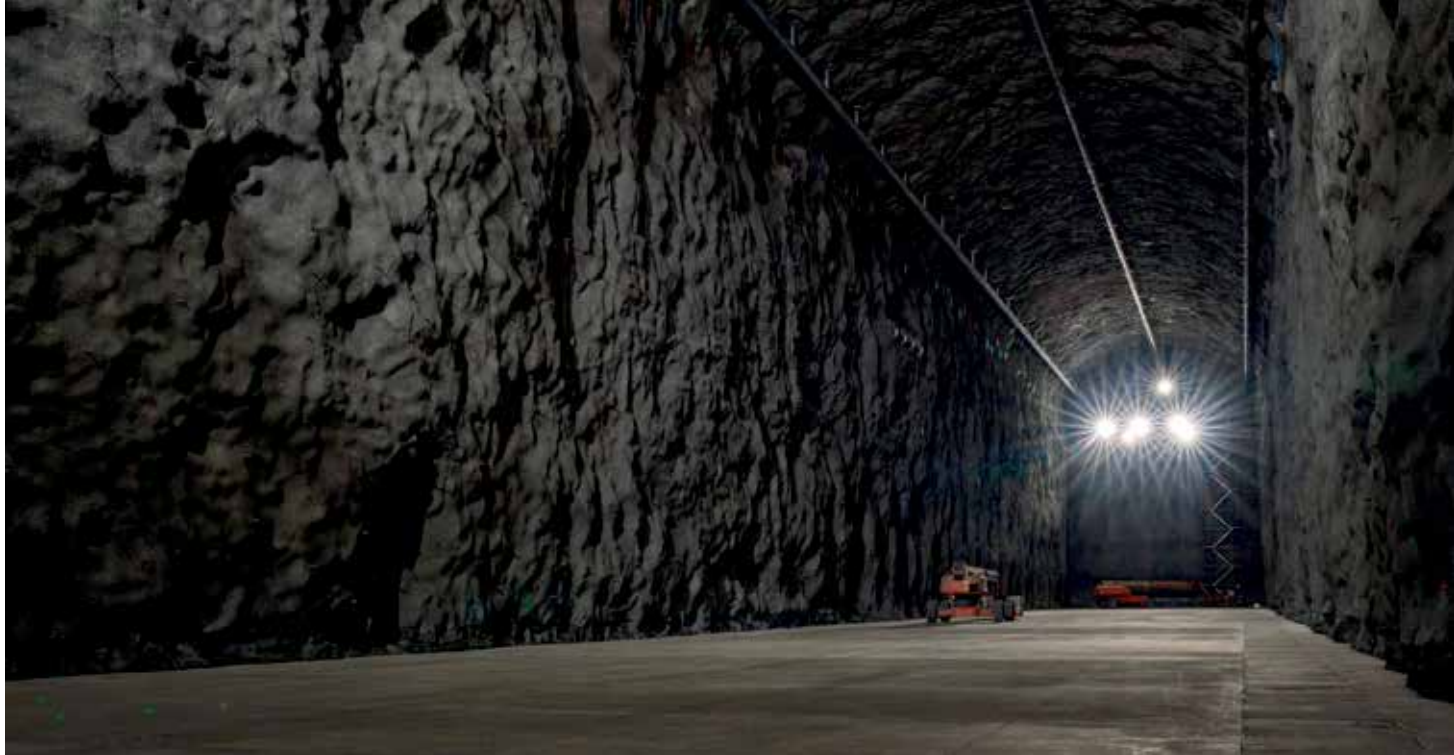
Caverna do experimento Dune em uma antiga mina de Dakota do Sul onde ficará um dos detectores de neutrinos