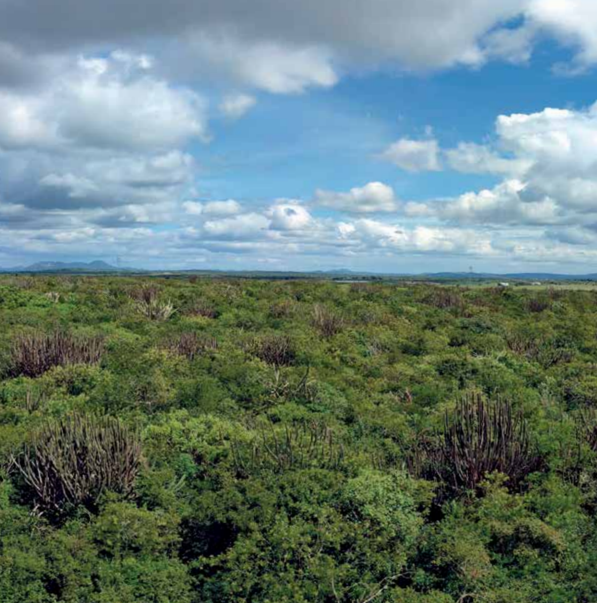
Floresta vista do alto de uma torre de observação no planalto de Borborema, em Campina Grande, Paraíba, durante a estação chuvosa

endêmicas (exclusivas), derivada principalmente do tipo de solo (ver mapa na página 68).