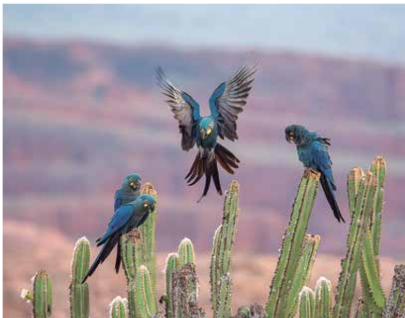
Araras-azuis-da-caatinga ( Anodorhynchus leari ), típicas do semiárido brasileiro

limita-se à Chapada do Apodi, na divisa entre os estados do Rio Grande do Norte e do Ceará, uma área com muitas cavernas. Um roedor de 20 centímetros, o rabo-de-facho ( Proechimys yonenagae ), e pelo menos 30 espécies de lagartos são exclusivos das dunas do rio São Francisco, nordeste da Bahia (ver Pesquisa FAPESP nº 57).