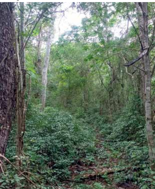
Mata preservada em Itapajé, Ceará

A segunda grande unidade da Caatinga, a caatinga de areia, é constituída por terrenos com rochas sedimentares que originaram solos arenosos e pobres em nutrientes. Por sua vez, é subdividida em quatro partes, cada uma com suas espécies próprias. A cebola-brava ( Cearanthes fuscoviolacea ) é uma das espécies endêmicas do distrito Ibiapaba-Piauí; o soldadinho-do-araripe