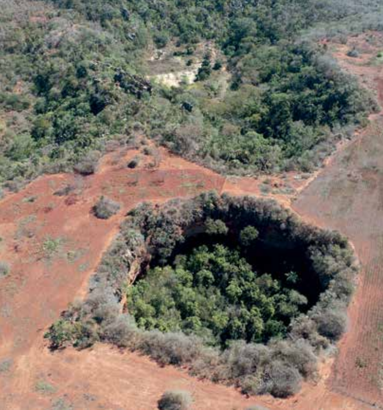
Árvores crescem em um buraco formado em terreno sedimentar de Irecê, Bahia