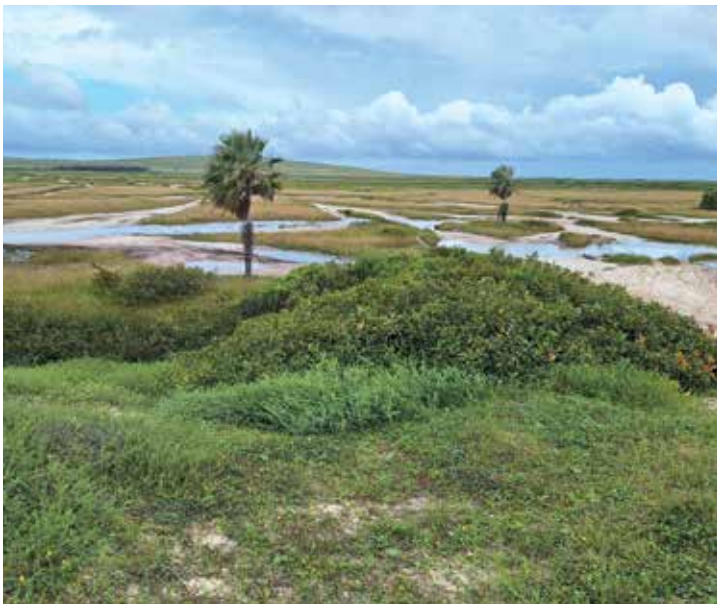
Campo costeiro com carnaúbas ( Copernicia prunifera ) no Parque Nacional de Jericoacoara, Ceará