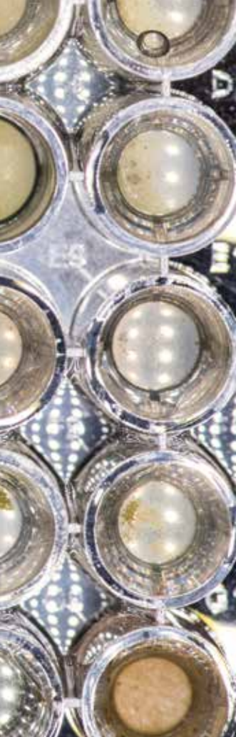
Cultivo de Chlorella sp. e Chlorolobion sp. em diferentes concentrações de vinhaça em laboratório da UFSCar

ainda há uma grande dificuldade de aumentar a escala de produção.