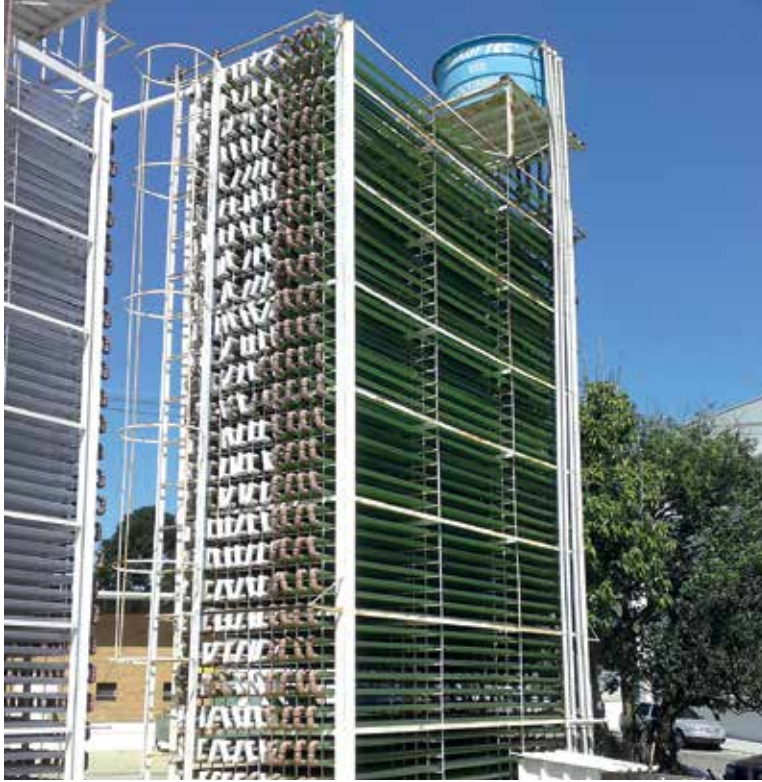
Fotobiorreator da UFPR usado para o cultivo de microalgas e a produção de biomassa

cionais. “Pretendo apresentar os resultados em novembro para as empresas que nos fornecem os resíduos da exploração de petróleo”, diz.