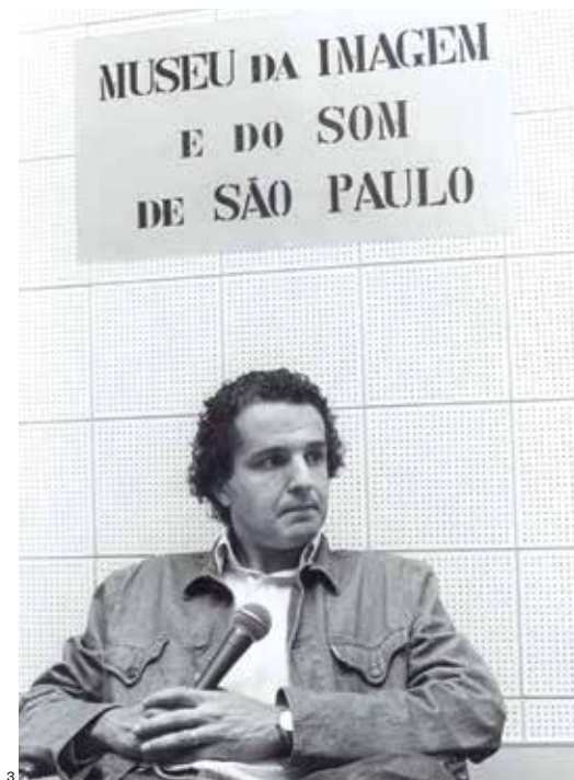
FOTOS 1 E 2 ACERVO MIS-RJ 3 AUTORIA DESCONHECIDA. ACERVO MUSEU DA IMAGEM E DO SOM DE SÃO PAULO 4 ANTONINHO PERRI/SEC/UNICAMP - RE TRATOS DO TEATRO (2013). DE BOB SOUSA 5 ANTONINHO PERRI/SEC/UNICAMP