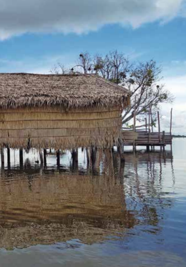
Casas e morador da planície inundável do Lago Grande de Curuai, em Santarém (PA), durante a cheia de junho de 2022