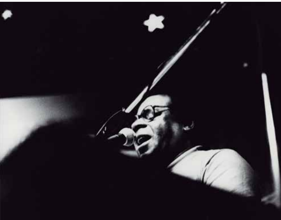
Os músicos Johnny Alf (à esq.) e João Donato, que transitaram pela bossa nova e pelo samba-jazz