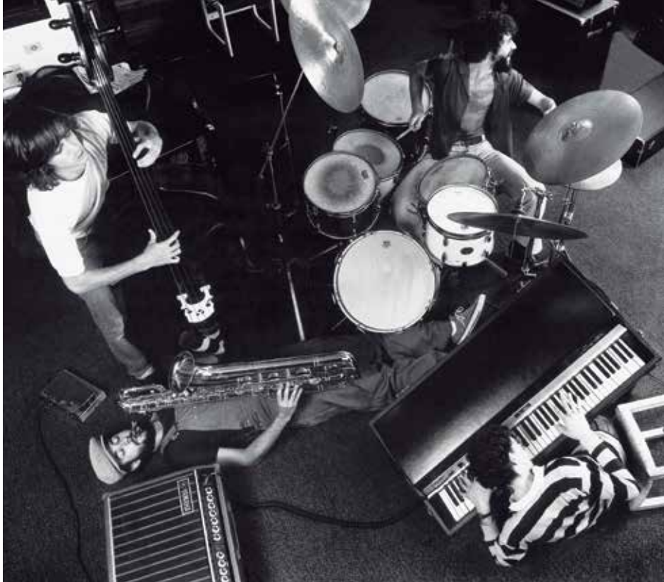
O Grupo Um, em 1982, e capas de discos das bandas Pau Brasil, Pé Ante Pé e Metalurgia