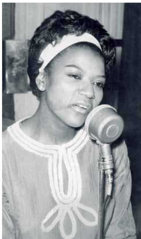
A cantora Alaíde Costa na década de 1960