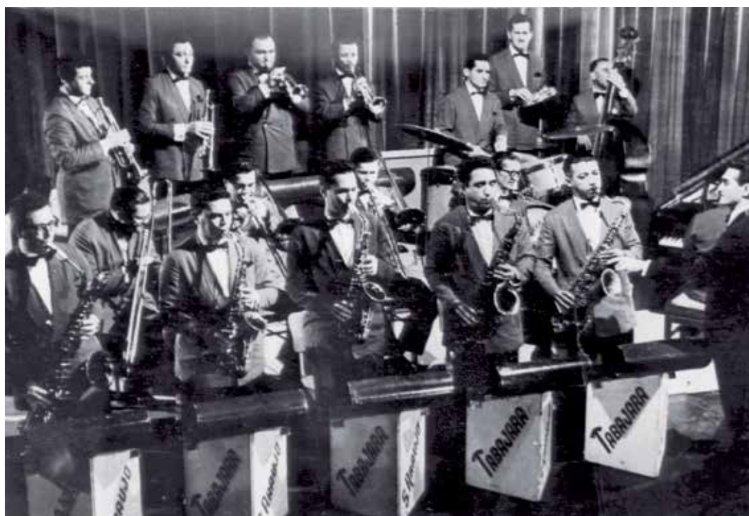
A Orquestra Tabajara, em registro s/d: visual inspirado nas big bands