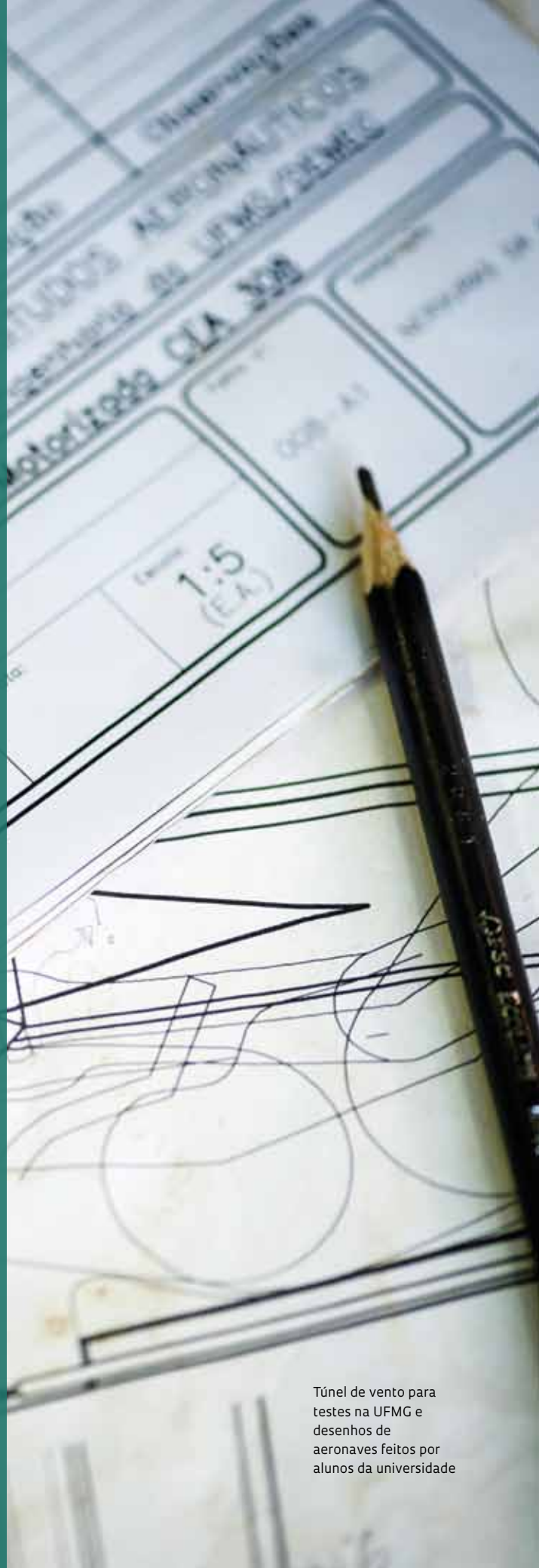
Túnel de vento para testes na UFMG e desenhos de aeronaves feitos por alunos da universidade

O voo do Sora-e corou dois anos de trabalho do engenheiro aeronáutico formado pela Universidade Federal de Minas Ge-