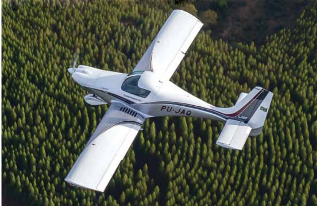
1 Monomotor Quasar: 60 aviões vendidos